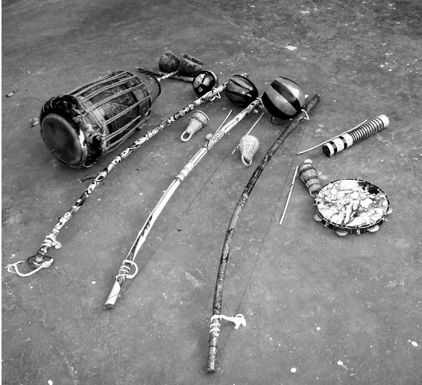
Les instruments traditionnels de la capoeira, construits dans l'atelier du Maître Lua Rasta (Salvador de Bahia, Brésil)

© Maître Lua Rasta (Salvador de Bahia, Brésil)