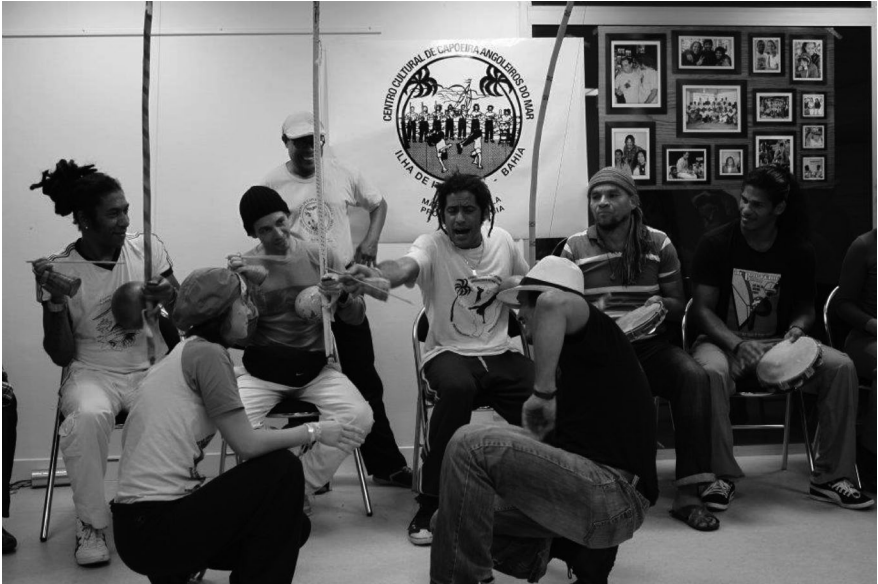
Samba Chula de São Braz