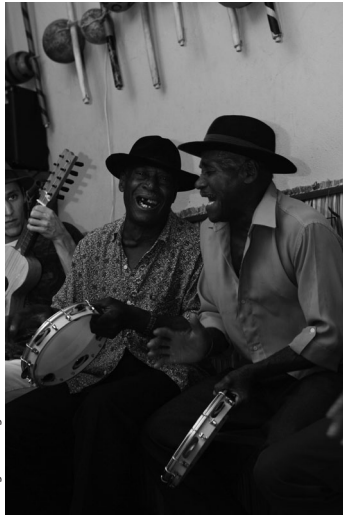
Une roda du Groupe Angoleiros Do Mar, sur l'île d'Itaparica (Bahia, Brésil)